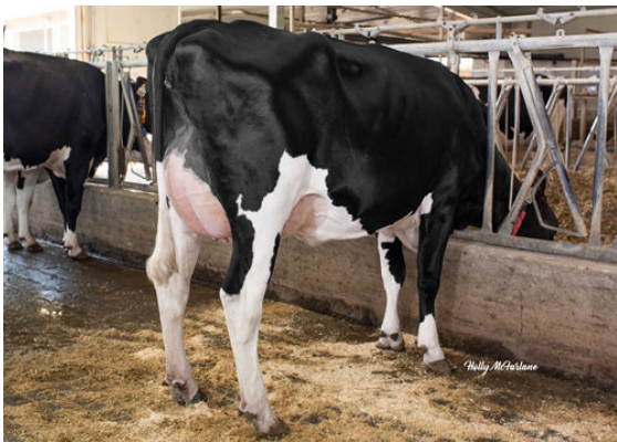
PROGENESIS OUTL WINTERBERRY DAM