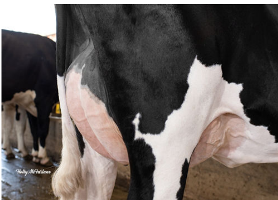
PROGENESIS OUTL WINTERBERRY DAM